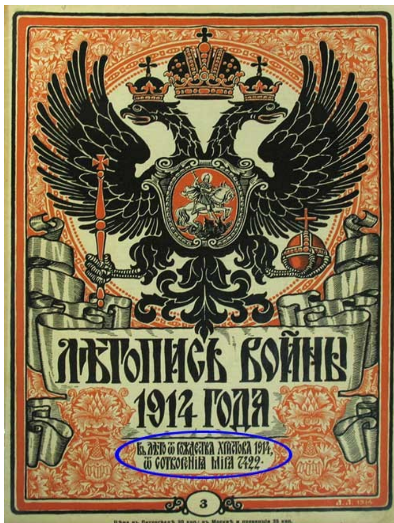
Dva kalendáře. Koloniální, který ukazuje rok 1914 a Tartarský 7422.

Z černé šlechty, která se nechtěla dělit o své majetky s lidem. Třeba Habsburkové (římsští císaři, černá šlechta v Evropě) měla majetky v Česku, Rakousku, Španělsku, atd-. Než aby rozdělili dědictví mezi x dědiců a tím by došlo k rozdělení majetku a moci, místo toho vytvořili korporaci a vytvořili radu – aneb konec vodníků v Čechách :-)